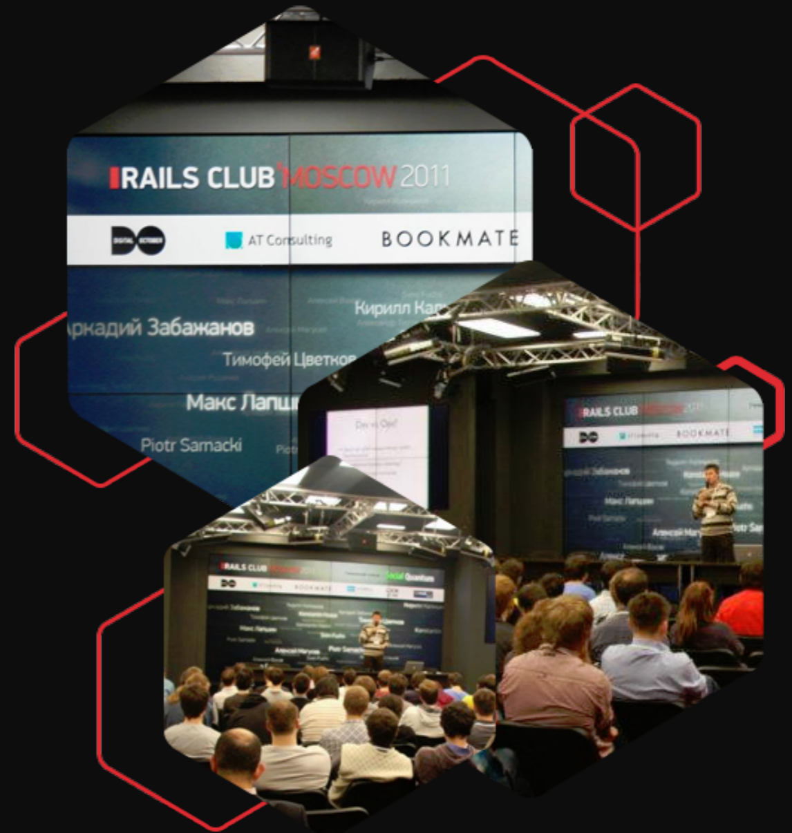
центральная видео стена на RailsClub'Moscow 2011